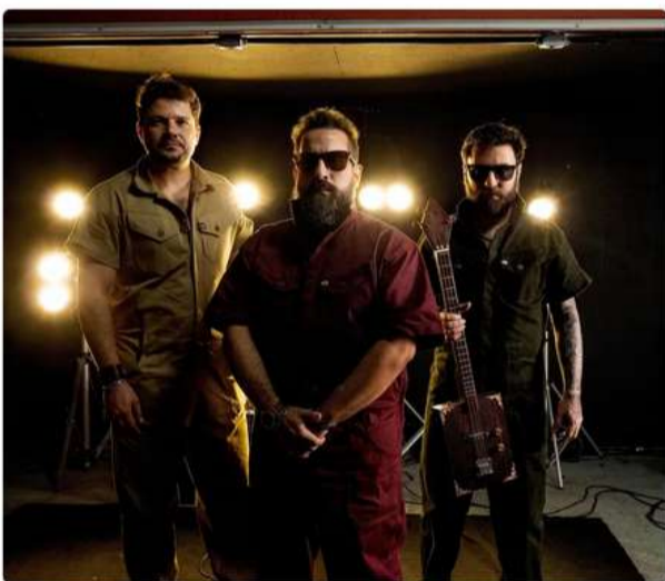
Formado em 2021, o trio mineiro de blues rock Cigar Box Band lança o primeiro álbum, "Don't belong", em 16 de fevereiro por gravadora M&O Music

23/01/2024 17:14 - Atualizado há uma semana